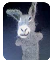
ELVIS der Esel