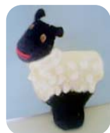
SOFIE das Schaf